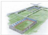
サッカーパーク(総合公園)