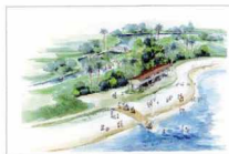
環境創造の森(護岸緑地)