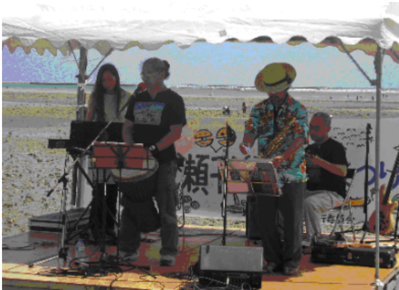
2008年の干潟を守る日、コンサート

10～14時までは、観察会（世界の貴重種カクレミノ、新種ミナミコメツキガニの大群集等） 奈良教育大学付属中学校修学旅行（干潟学習）午前3グループ、午後2グループ 14～15時は小集会（干潟を守る日、アピール採択、意見表明など） 15時～17時までは波の音を聴きながらコンサート、海の幸を味わう。 コンサート：知念良吉（及び大震災の被災に遭った東北のミュージシャン）、KEN子 海の幸を味わう：マグキヤチ、アーサ汁、オニギリ（泡瀬オゴノリ入り）、マグ酢の物